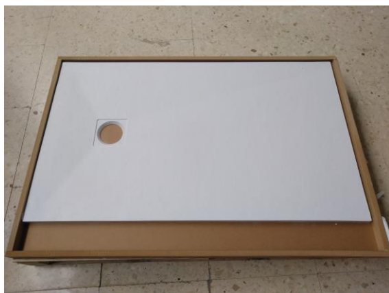
Muestra referencia 1708029-01

Muestra referenciada en AIDIMME como 1708029-01