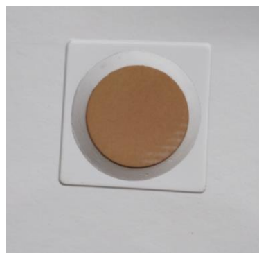
Detalle del orificio del desagüe